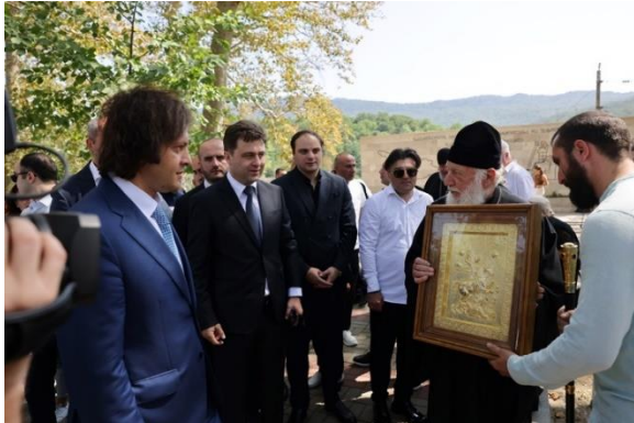
31 აგვისტო. ქალაქი ტყეზული.