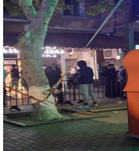
14 სექტემბერი, სოფელი ჯუმი