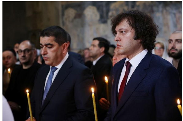
14 ოქტომბერი. მცხეთა.