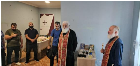
1 სექტემბერი. თერჯოლა.