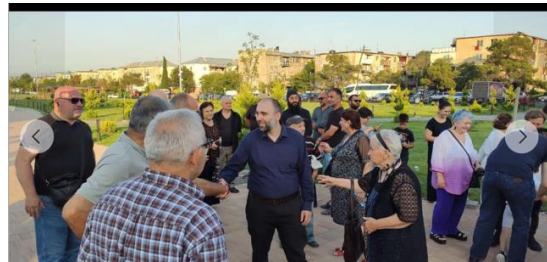
4 სექტემბერი, რუსთავი