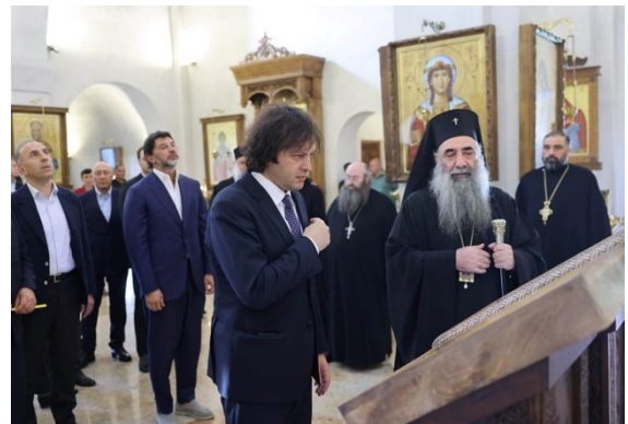
8 სექტემბერი. შალვა ახალციხელის სახელობის ტაძარი