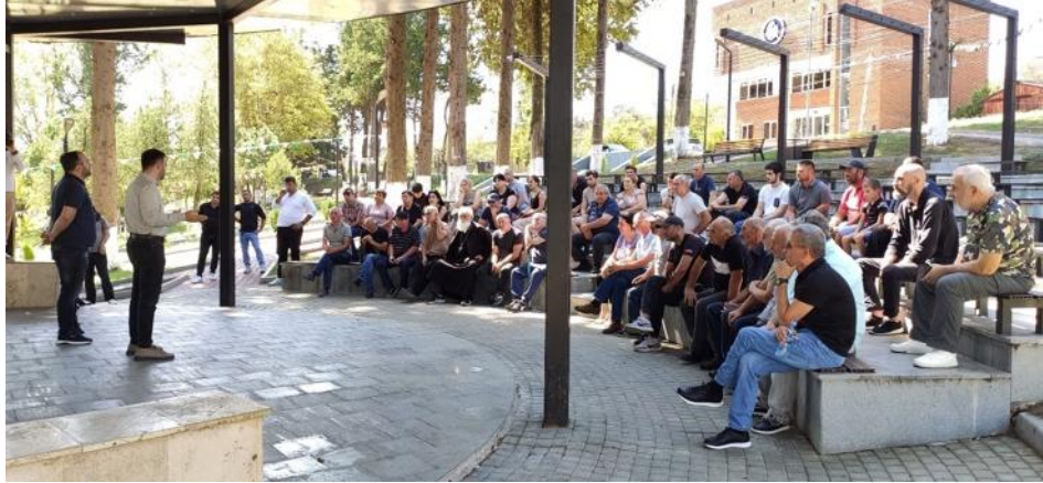
14 სექტემბერი. თერჯოლა.