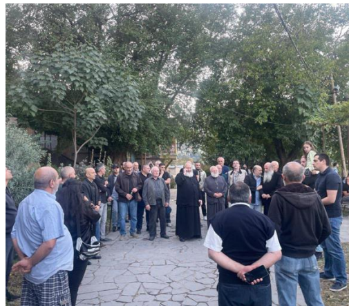
6 ოქტომბერი. ზემო ბეთლემის ტაძარი