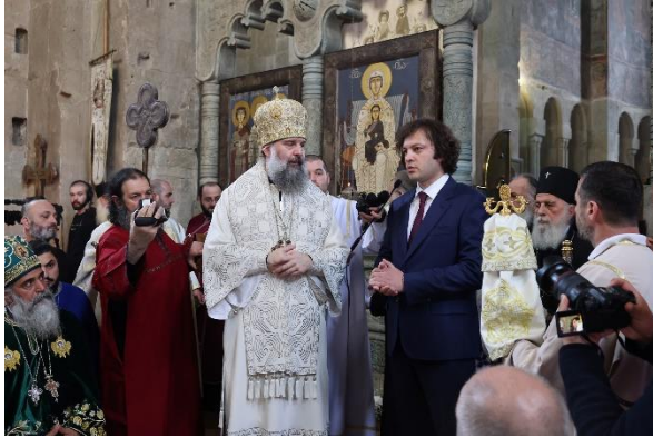
14 ოქტომბერი. მცხეთა.