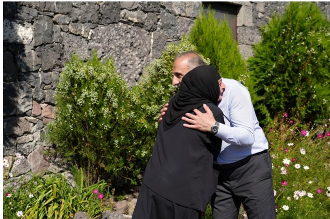
4 სექტემბერი. სოფელი რიყე.