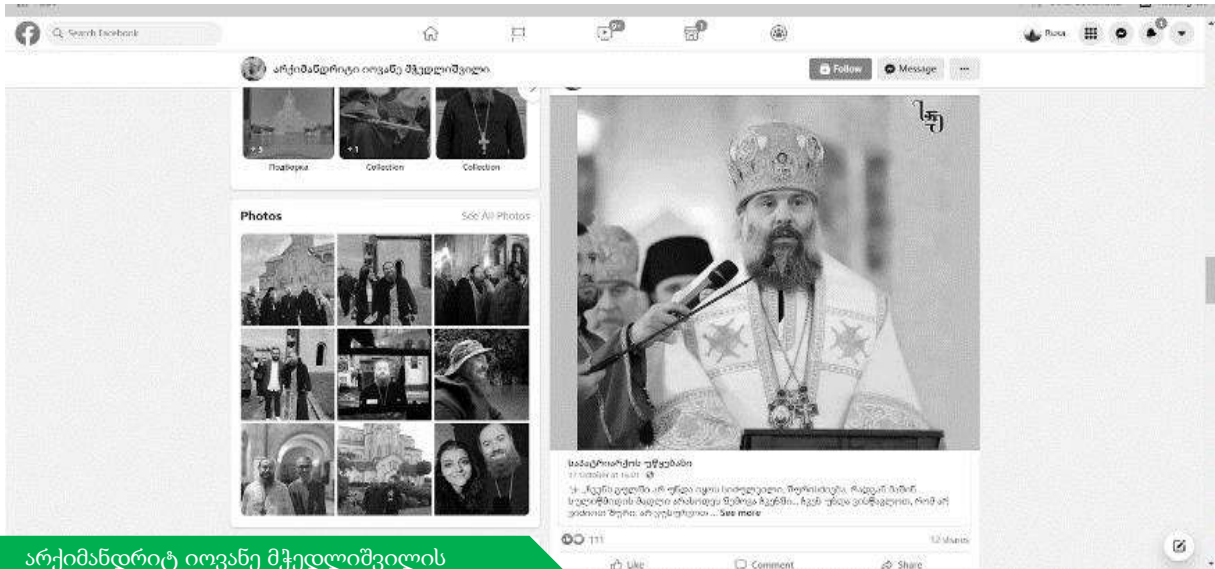
არქიმანდრიტი იოვანე მჭედლოშვილის ფესიბუქ გვერდი